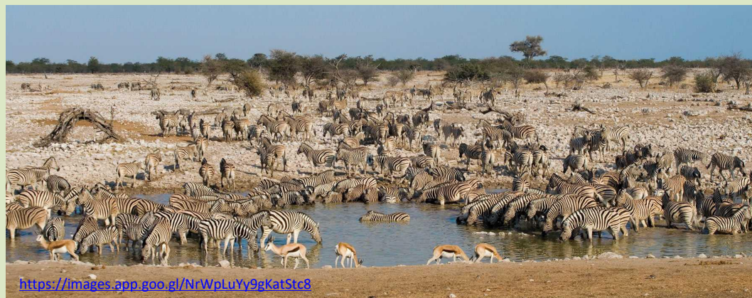
Слана пустиња (Etosha Pan)