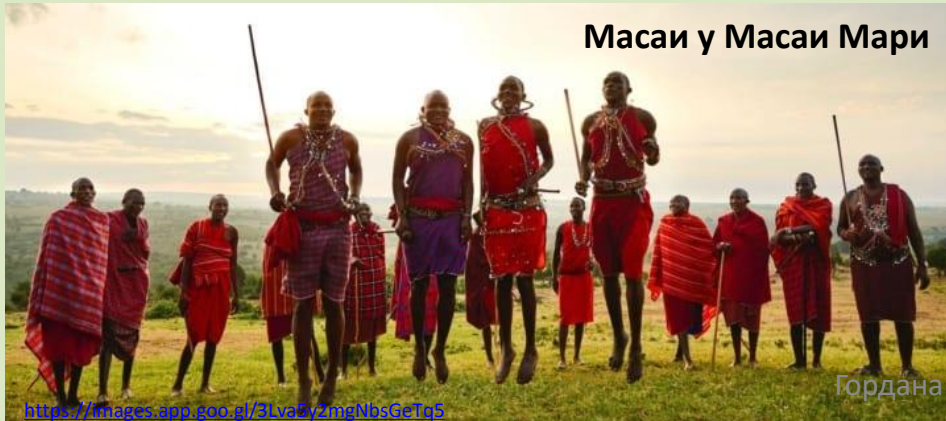
Масаи у Масаи Мари

Национални парк Серенгети се налази у истоименој области у Танзанији. Један је од најпознатијих националних паркова у свету, препознатљив по сеоби милион гнуа и 200.000 зебри, сваке године. Површина парка је 14.763 км 2 , углавном саванског простора. Серенгети лежи уз границу са Кенијом на северу где се наставља у заштићену област Масаи Мара, док се на југу наставља на заштићену област Нгоронгоро. У националном парку Серенгети је развијен и ловни туризам где су као трофеји највише заступљени – лав, леопард, слон, црни носорог и афрички биво.