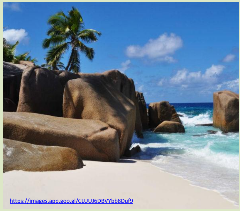
Национални парк Куриус острва, Сејшели

https://images.app.goo.gl/CLUUJ6DBVYbb8Duf9