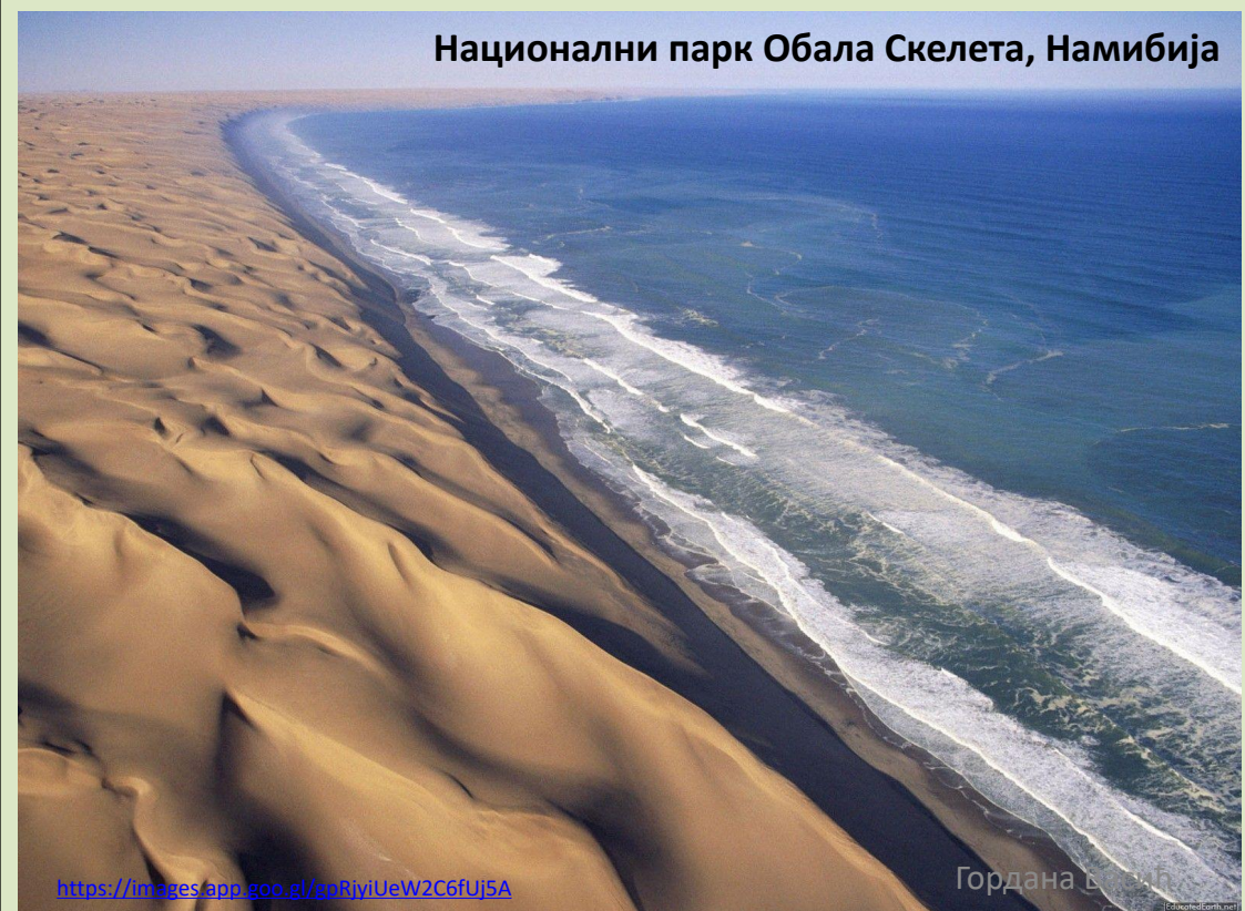
Национални парк Обала Скелета, Намибија

https://images.app.goo.gl/gdRiyiUeW2C6fUJ5A