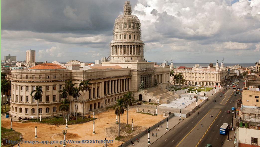
Капитоло, бивши Парламент Кубе, данас седиште министарства науке

https://images.app.goo.gl/sWecxi8ZXXkTd8CM7