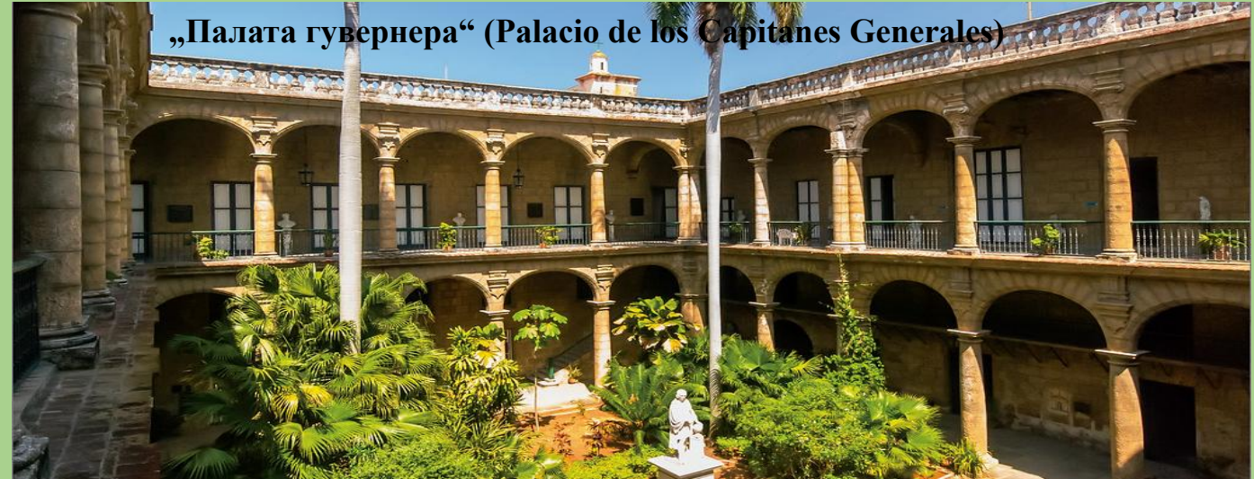
„Палата гувернера“ (Palacio de los Capitanes Generales)

Хавана је главни и највећи град на Куби. Град је 1515. године основао конкистадор Дијего Веласкез. У почетку је то била трговачка лука а од 1607. године је главни град шпанске колоније Куба.