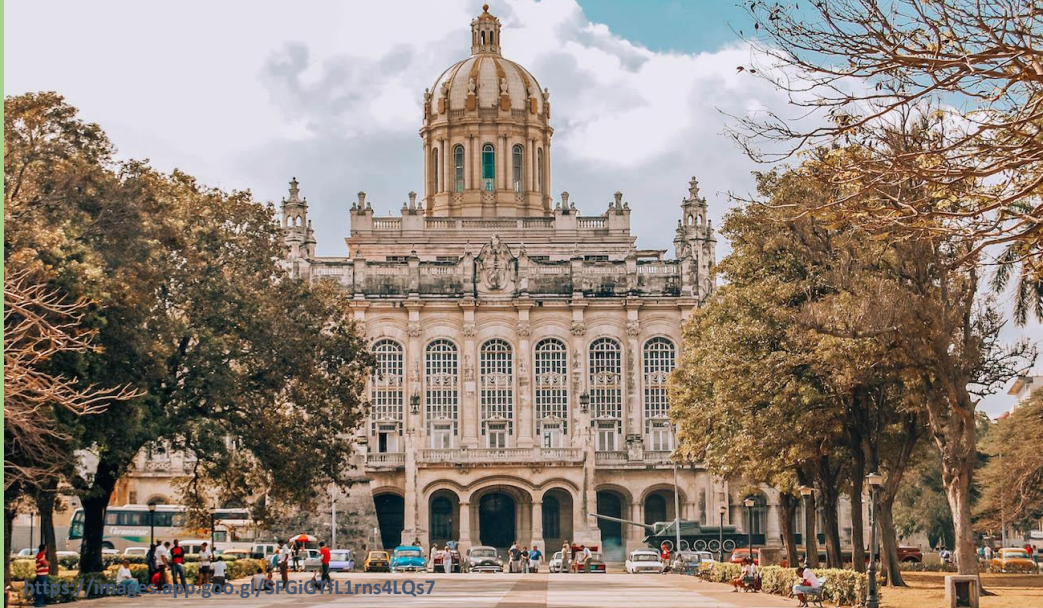
Музеј револуције (бивша Председничка палата)