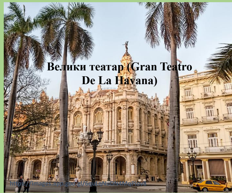
Велики театар (Gran Teatro De La Havana)

https://images.app.goo.gl/sWecxi8ZXXkTd8CM7