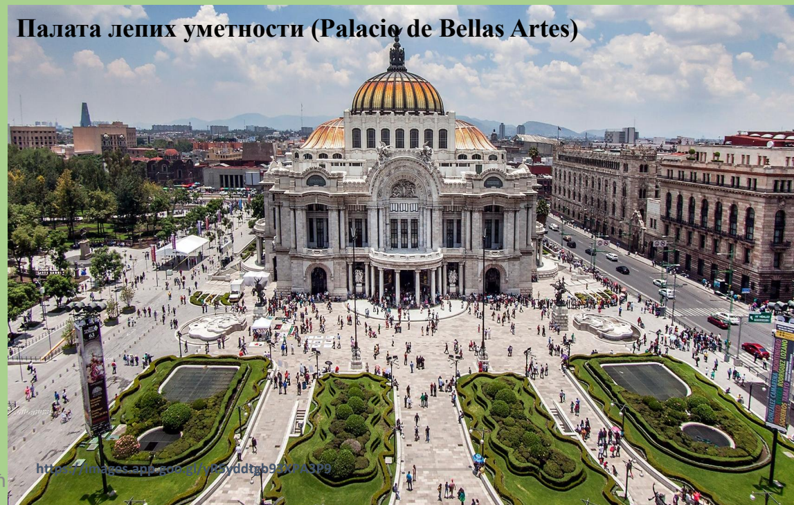
Палата лепих уметности (Palacio de Bellas Artes)